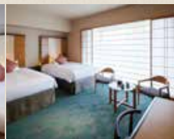
コンフォートツイン