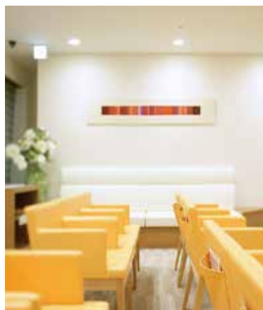
7F レディースフロア 女性の方にリラックスして検査を受けて いただけるように女性専用フロアを設置。