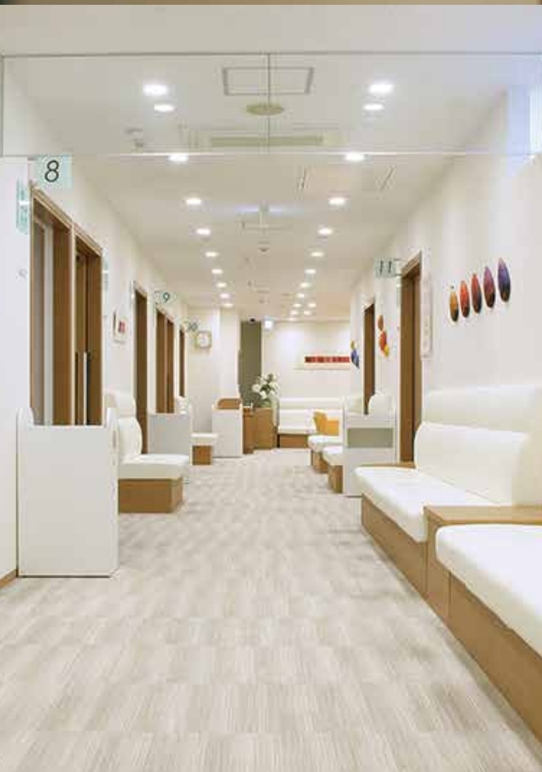
レディースフロア