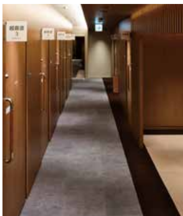
2F 特別ドックセンター・PHS 詳細な検査とアメニティサービスをご提供。 2024年にリニューアル。