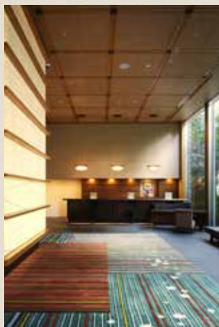
洗練された空間でくつろげる『庭のホテル 東京』