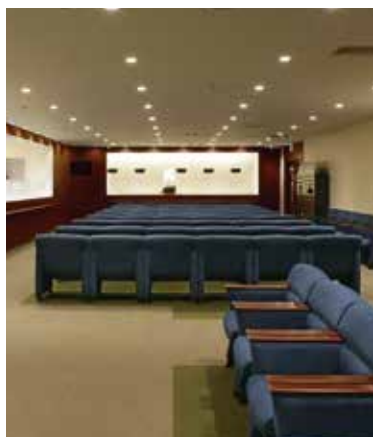
5F 人間ドック・健診 受付 スタンダードコース(Aコース)や 各種健診の受付。