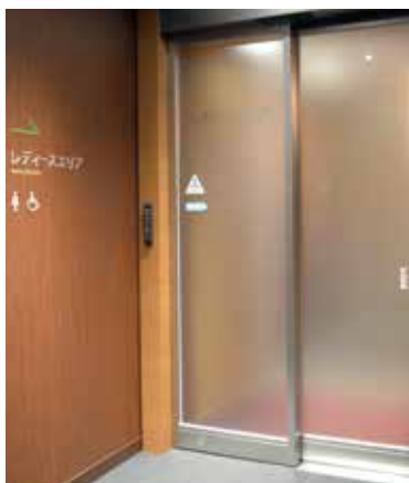
6F 男性更衣室 / レディースエリア 2015年にレディースエリアを増設。