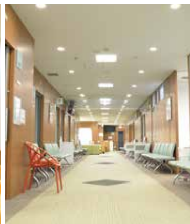
8F 人間ドック・健診 スピーディに受診いただけるよう待ち時間の 少ない検査にご案内するコンシェルジュを 各フロアに設置。