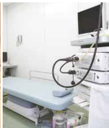
4F 内視鏡センター 体への負担が軽い、経鼻内視鏡機器を設置。 検査室を8部屋へ増設。