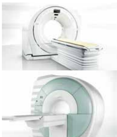
1F 画像検査センター(CT / MRI) 64列マルチスライスCT / 1.5テスラMRIを 設置。