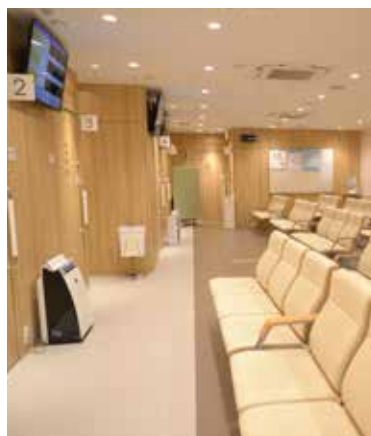
3F 再検査・精密検査・外来診療 各分野に特化した専門医が効果的な 診療をご提供。2023年にリニューアル。