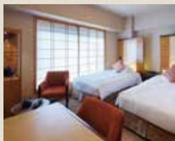
スーパーリアツイン

Cコース宿泊タイプをお選びになった方には、モダンで洗練された空間が人気の『庭のホテル 東京』をご用意いたします。通院しやすいロケーションと心地よい空間をあわせもつホテルでくつろぎながら、リラックスして人間ドックに臨むことができます。